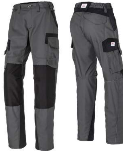
Anthrazit | Schwarz 2530 5370-9799 D34-D54