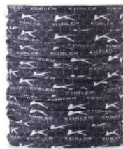
Multifunktions Tuch 8104 9214-99 One size