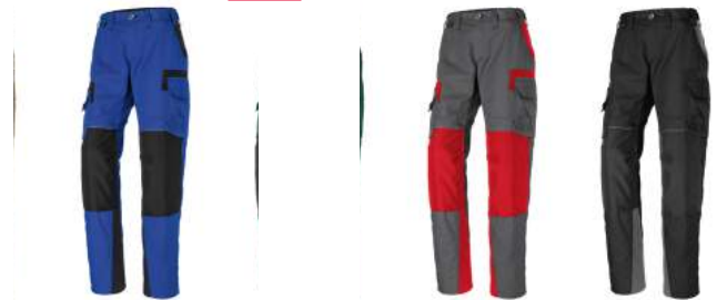
Sandbraun | Schwarz 2530 5370-2599 D34-D54