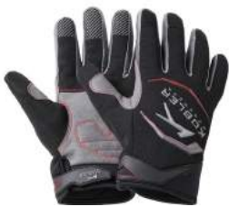
Arbeitshandschuhe 8001 9414-9995 S-3XL