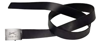
Ledergürtel 8401 9111-99 Länge: 115 cm

Mehr Infos im aktuellen GESAMTKATALOG oder unter www.kuebler.eu