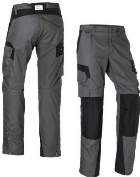
Anthrazit | Schwarz 2230 5370-9799 40-66, 90-118, 25-31