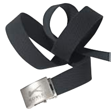
Gürtel Kofferband Schwarz 8401 9113-99 Länge: 115 cm