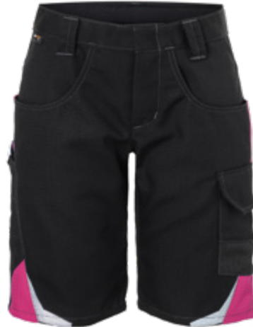
Schwarz | Pink 2724 5353-9952 98/104-158/164