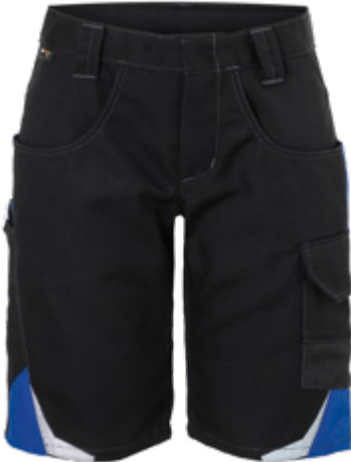
Schwarz | Kbl.blau 2724 5353-9946 98/104-158/164